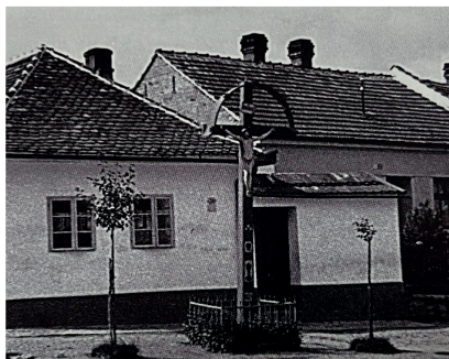
Historická fotografie kříže pocházející z knihy Panna Maria v Třešních

V nové rubrice Svědkové víry vám budu pravidelně přibližovat historii míst a událostí spjatých s náboženským životem v Lišni. První z nich je dřevěný kříž na rohu ulic Šimáčkova a Střelnice, na místě zvaném „U Marketu“.