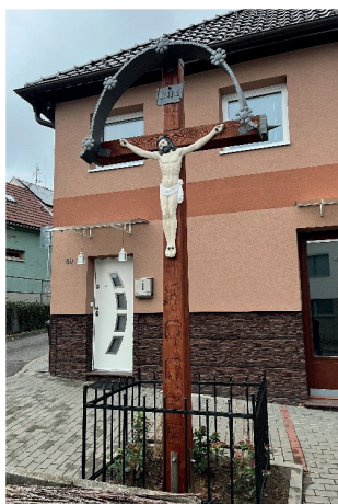
Kříž říjen 2025

Až půjdeme kolem nejen v průvodech, ale i při všedních cestách, může nám být tento svědek víry podnětem k zamyšlení, zda budujeme svůj život na Kristu a nechat Spasitele působit v každodenním životě.